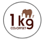
缶バッジイメージ

また当イベントにて投票にご参加いただいた方には、1キログラムのCO2排出権付きのカーボンオフセット缶バッジと、エコ・アクション・ポイントをプレゼントいたします。